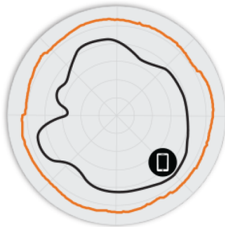
图 3. T750 5GHz 方位 天线模式