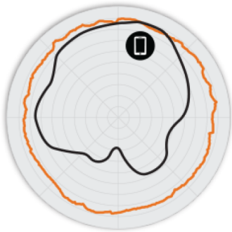
图 2. T750 2.4GHz 方位 天线模式