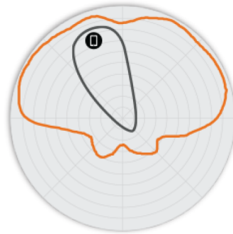
图 4. T750 2.4GHz 俯仰 天线模式